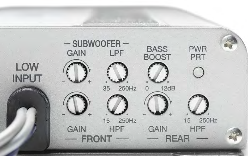
Panel sterowania XC2510