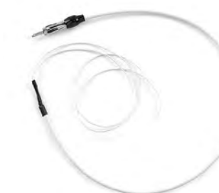
CMC-WHTANT-AM/FM Pod Motorola antena AM/FM